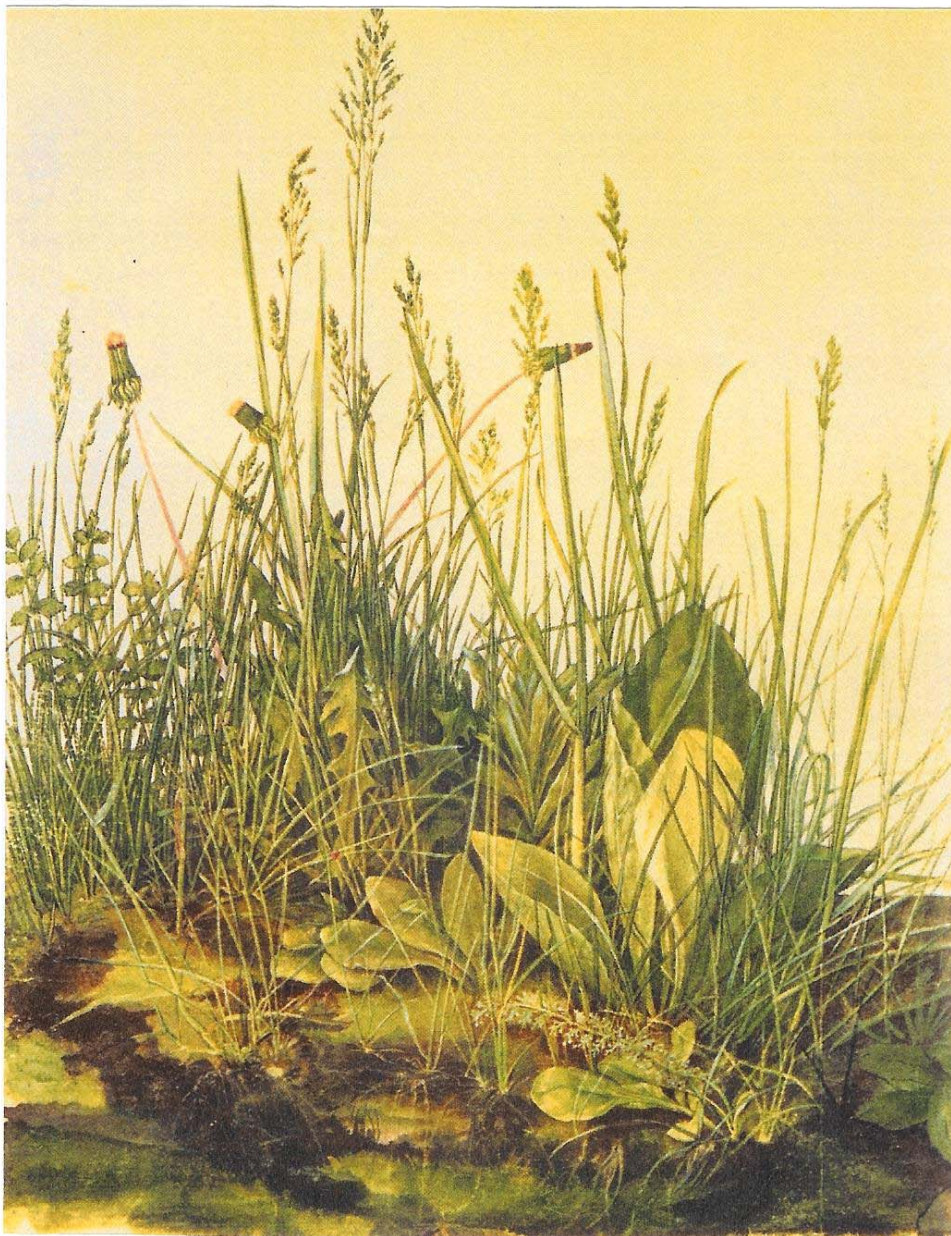
Άλμπρεχτ Ντύρερ «Μεγάλο Κομμάτι χορταριασμένη γη» 1503

Υδατογραφία πενάκι και μελάνι, μολύβι και αραιωμένο χρώμα πάνω σε χαρτί, 40,3 × 31,1 εκ. Άλμπερτίνα, Βιέννη