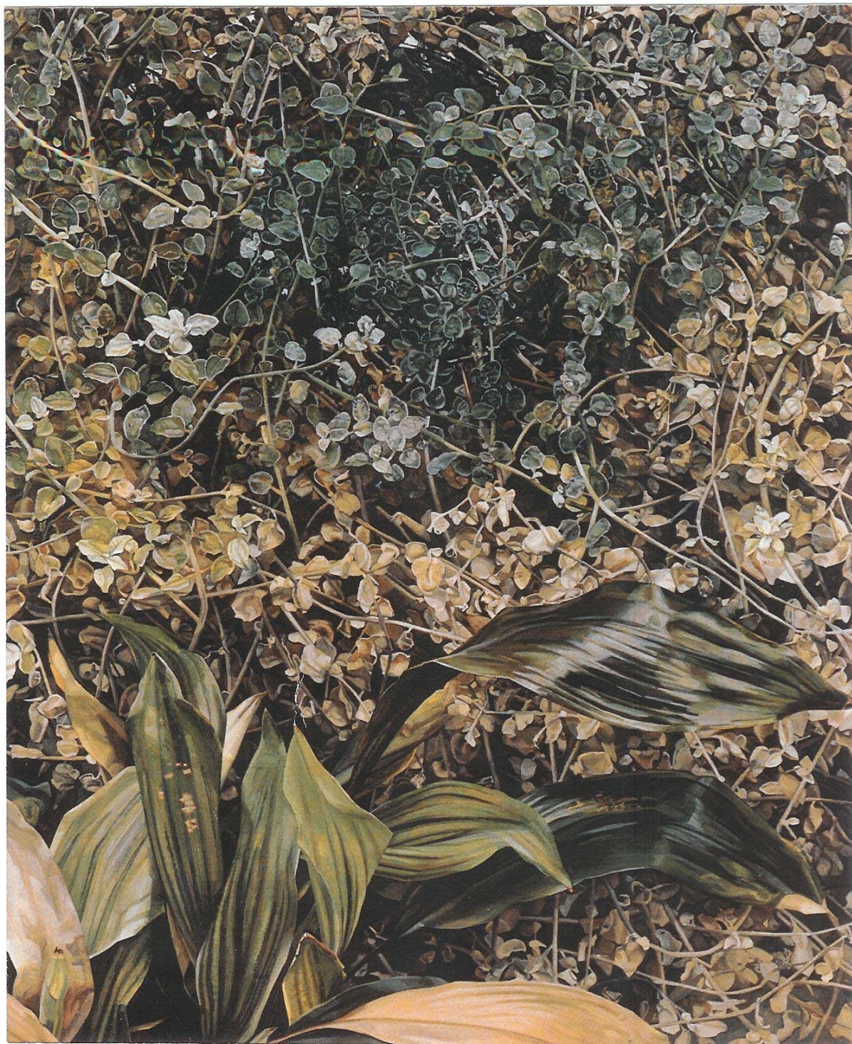
Λούσιαν Φρόντ «Δύο φυτά» 1977-80